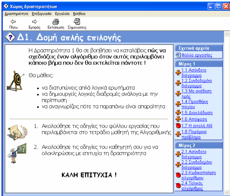
Σχήμα 3: Προβάλλοντας ένα σενάριο στον Χώρο Δραστηριοτήτων

Επειδή ο Χώρος Δραστηριοτήτων παρέχει μια βολική μορφή αναπαράστασης σεναρίων για όλα τα μαθήματα, όχι μόνο αυτά που αφορούν στην διδασκαλία της αλγοριθμικής, προτιμήθηκε να αναπτυχθεί ως ανοιχτό λογισμικό ώστε να είναι δυνατή η συντήρηση και βελτίωσή του από οποιονδήποτε ενδιαφερόμενο. Έτσι ο Χώρος Δραστηριοτήτων διατίθεται με άδεια GNU GPL (GNU General Public License), ενώ ο πηγαίος κώδικας και τα εκτελέσιμα θα αναρτηθούν στον δικτυακό χώρο ανοιχτού λογισμικού http://activityspace.sourceforge.net για την εύκολη ταυτόχρονη πρόσβαση στον κώδικα από προγραμματιστές και τη λήψη νέων εκδόσεων από τους καθηγητές.