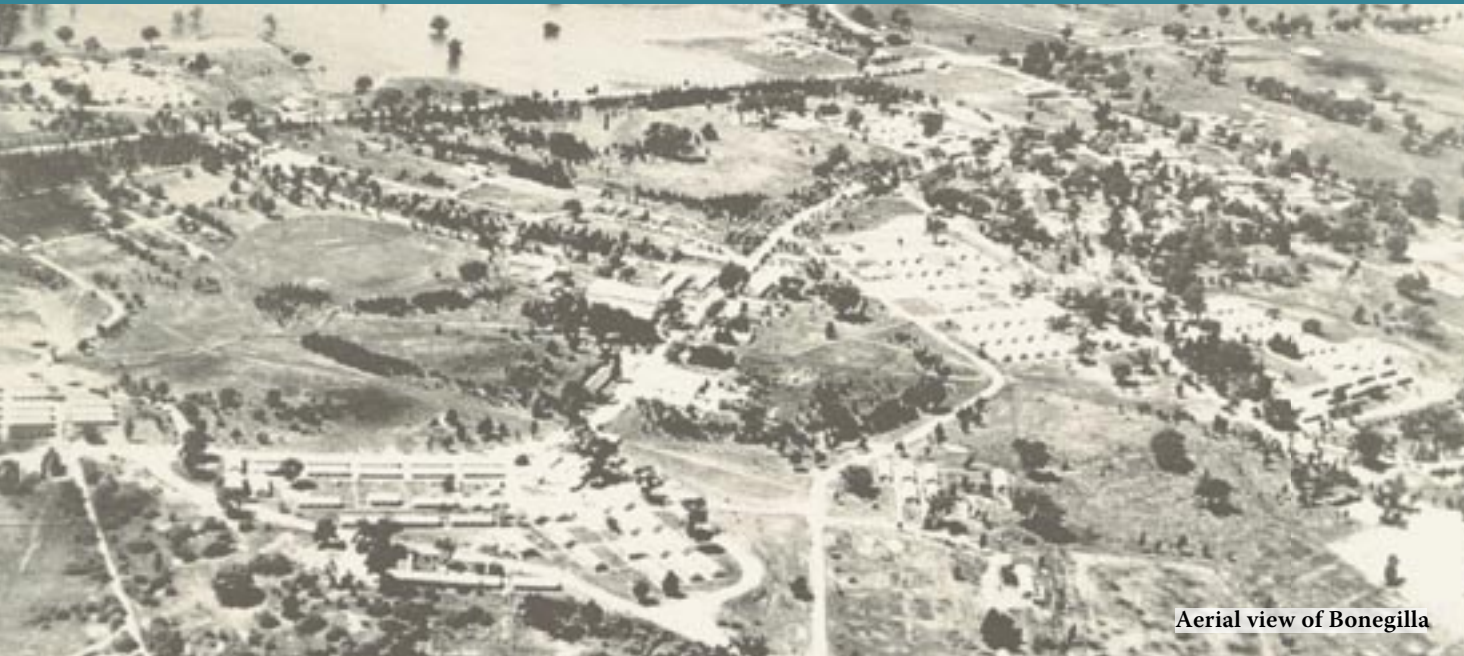
Aerial view of Bonegilla

Η ΖΩΗ ΣΤΗΝ ΜΠΟΝΕΓΚΙΛΛΑ Memories of Bonegilla